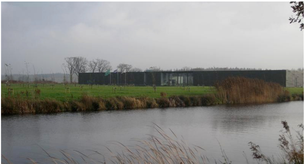
het landschapspark met het museum

Verder wordt ook onderzocht of museum Belvédère een tentoonstelling kan maken van twee dimensionaal werk dat eerder ontstond uit het project Hortus Conclusus, en of de museumwinkel een rol kan spelen bij de verkoop van de uitgave bij het project Hortus Conclusus 't Janboersmeulentien.